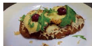
Schnitzel - Melba

Stellen Sie sich Ihr Wunschbüffet zusammen ab 20 Personen 13,90 €