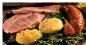
Grünkohl mit Kartoffeln, Kassler und Kohlwurst

Grünkohl , Kartoffeln, Bratkartoffeln, Kassler, Kohlpinkel und Mettwurst 13,90 €